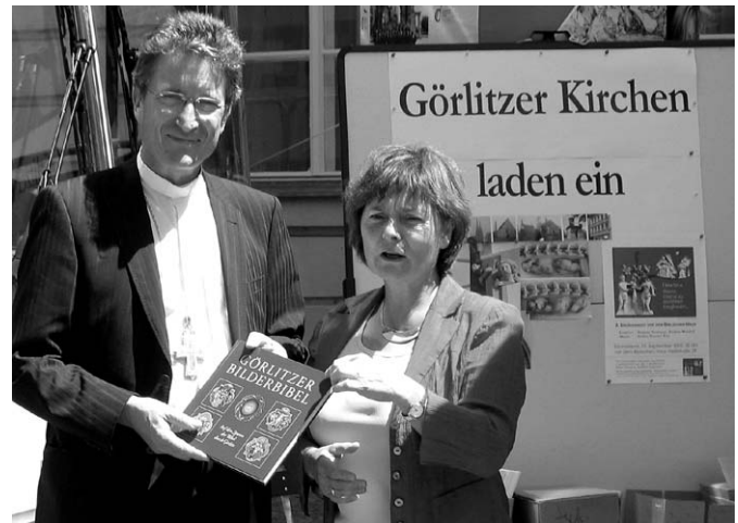
Bischof Huber und OKRin Kempgen am Görlitzer Stand

setzung in analoger Lesegeschwindigkeit zu halten. Und genau hier setzte einmal mehr die zauberhafte Gelassenheit solcher Tage ein. Singende und feiernde Menschen, sich unbekannt Umarmende, miteinander Lachende und Weinende. „Zur Hoffnung eingeladen“ – ja, man war angekommen.