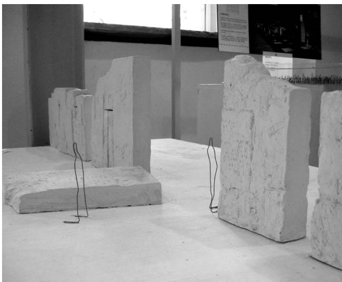
Favorisiertes Modell der künftigen Gedenkstätte

Endlich werden auch die Breslauer der Deutschen gedenken können, die auf den vielen, heute leider nicht mehr existierenden Friedhöfen der Stadt bis zum Ende des Krieges beerdigt wurden: es entsteht ein Denkmal der gemeinsamen Erinnerung, eine symbolische Grabstätte, für alle deutschen Bewohner der Stadt, die heute in Breslau kein Grab haben, da viele Friedhöfe aus der deutschen Zeit nicht mehr existieren. Die Bewohner der niederschlesischen Metropole, die vor dem Kriege in Breslau gewohnt haben und nach Kriegsende ihre Heimat verlassen mußten, hatten in Breslau auch die Gräbstätten ihrerer Nächsten hinterlassen. Für viele Breslauer, die aus Deutschland nach Schlesien zu Besuch kommen sind die Gräber ihrer Nächsten schon nicht mehr auffindbar. Jetzt werden diese Menschen wenigstens an der Zentralen Gedenkstätte für deutsche Breslauer ihren Blumenstrauß niederlegen können.