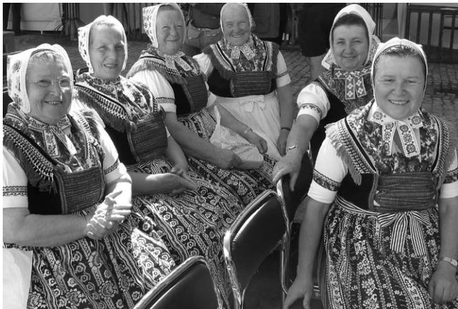
Sorbinnen aus der Oberlausitz